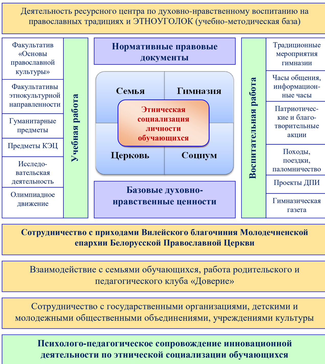
Рис. 2. Модель этнической социализации обучающихся в образовательном пространстве гимназии

образовательном пространстве ГУО «Вилейская гимназия № 2» можно представить следующим образом (Рис. 2):